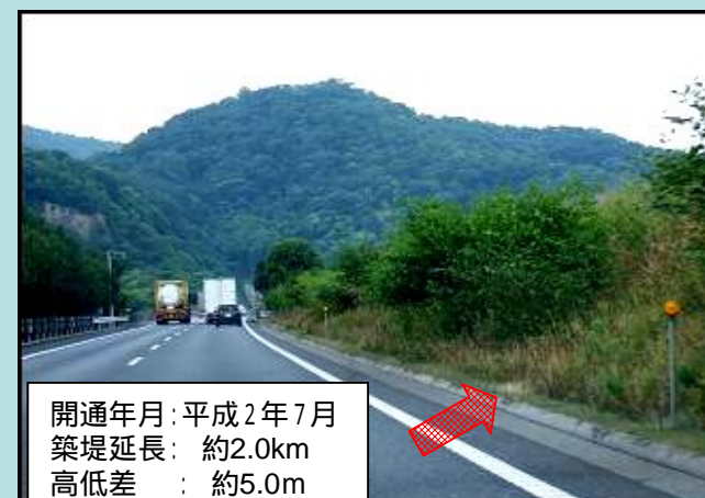
山陽自動車道 姫路西IC～龍野IC間