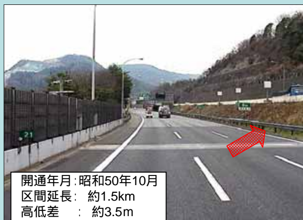
中国自動車道 宝塚IC付近