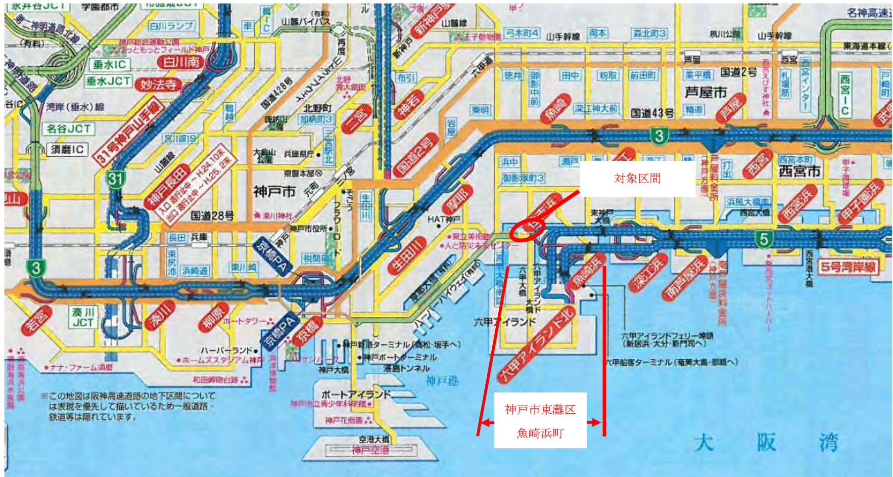
位置図 (神戸市東灘区魚崎浜町区間)