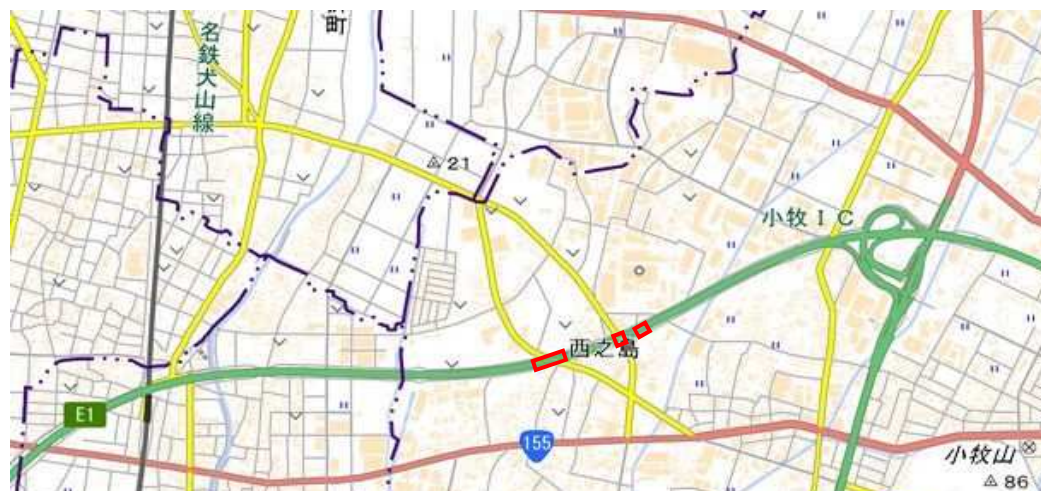
位置図（三ツ渚第二、三高架橋、西之島第一高架橋）