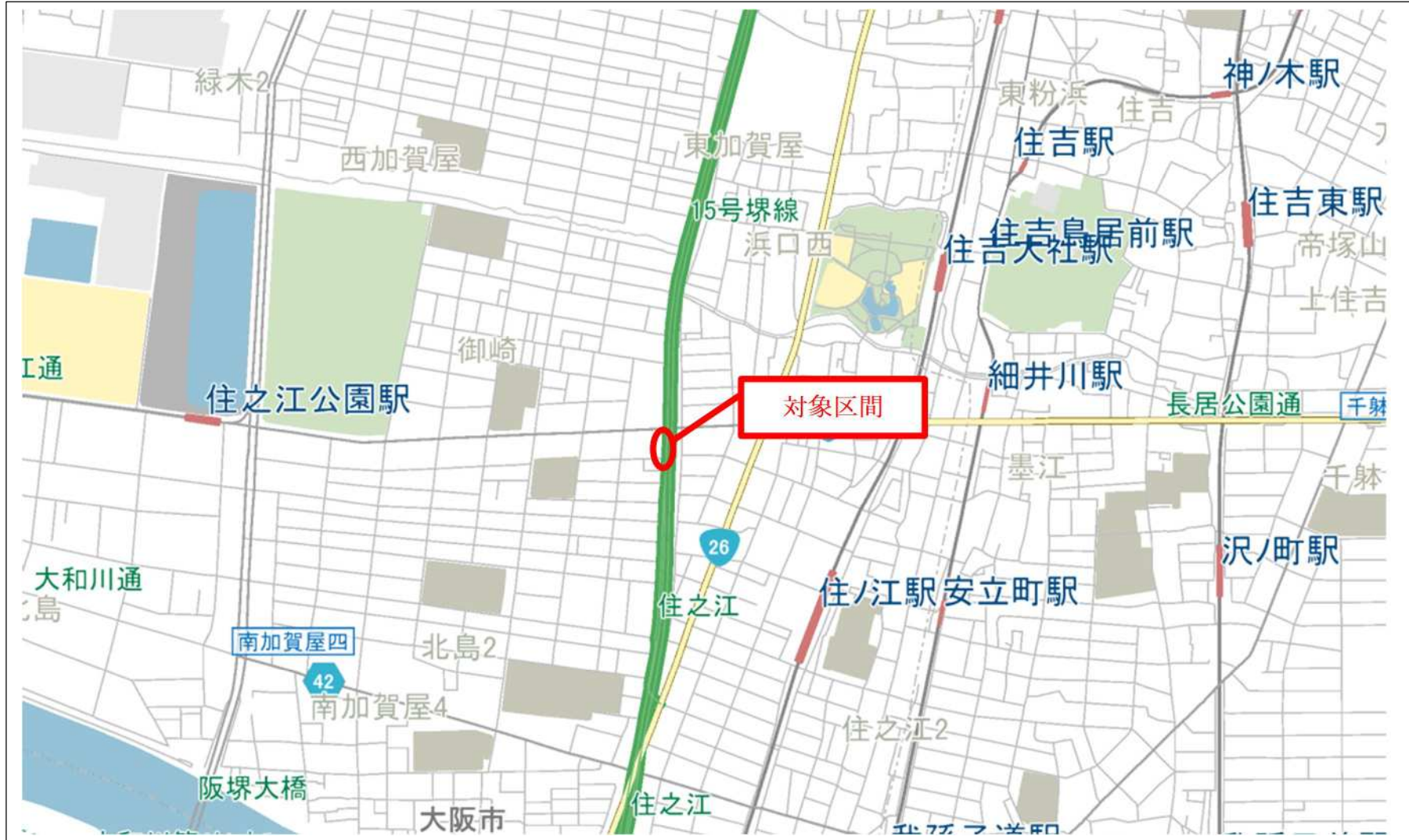
位置図（大阪市住之江区御崎町区間）