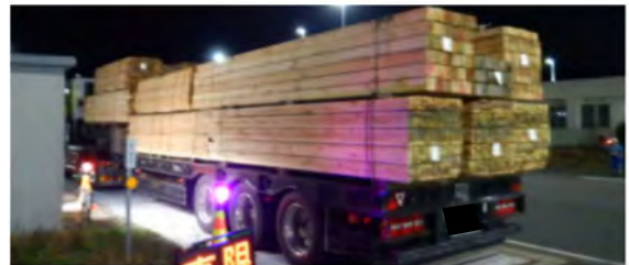
違反車両(積載物: 板材)