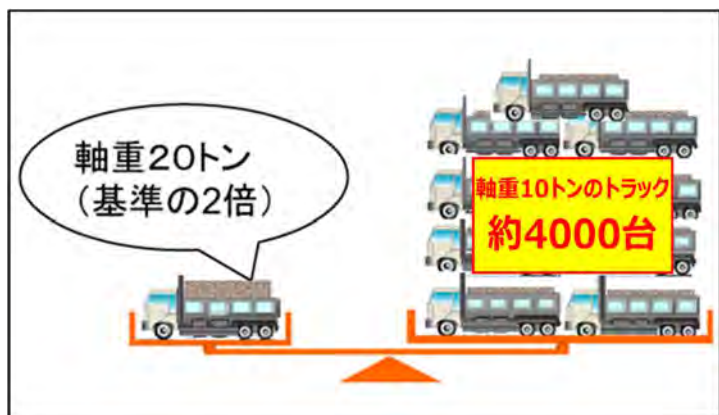
床版に与えるダメージ