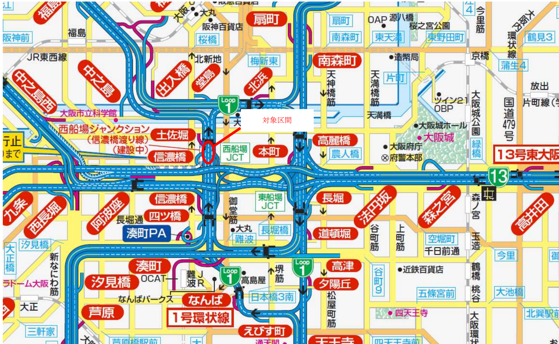
位置図（大阪市西区靱本町区間）