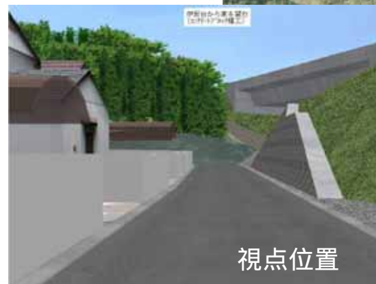
VRで準備した資料の例

協議の結果、地元の同意を得られ、当初計画と比較してもコスト縮減が図られる見込み。