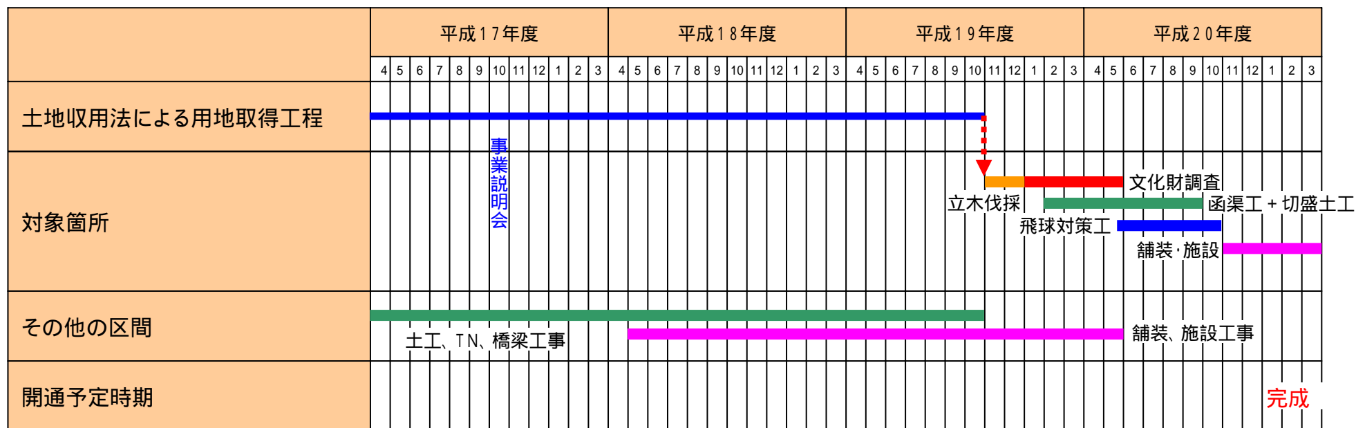
土地収用法による用地取得での当初工事工程表