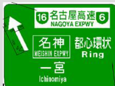
当初計画の3段表示