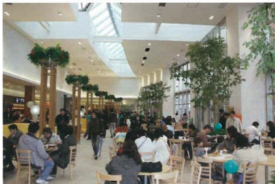
フードコート客席 (開放的な高い天井、明るいトップライト)