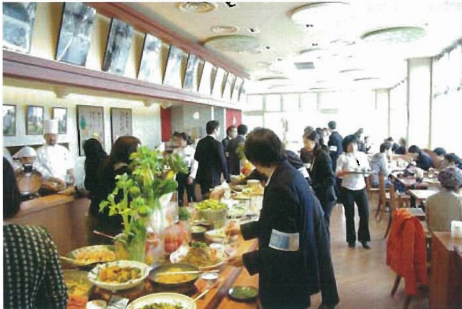
ビュッフェレストラン